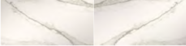
Super Blanco-Gris A Natural Natural