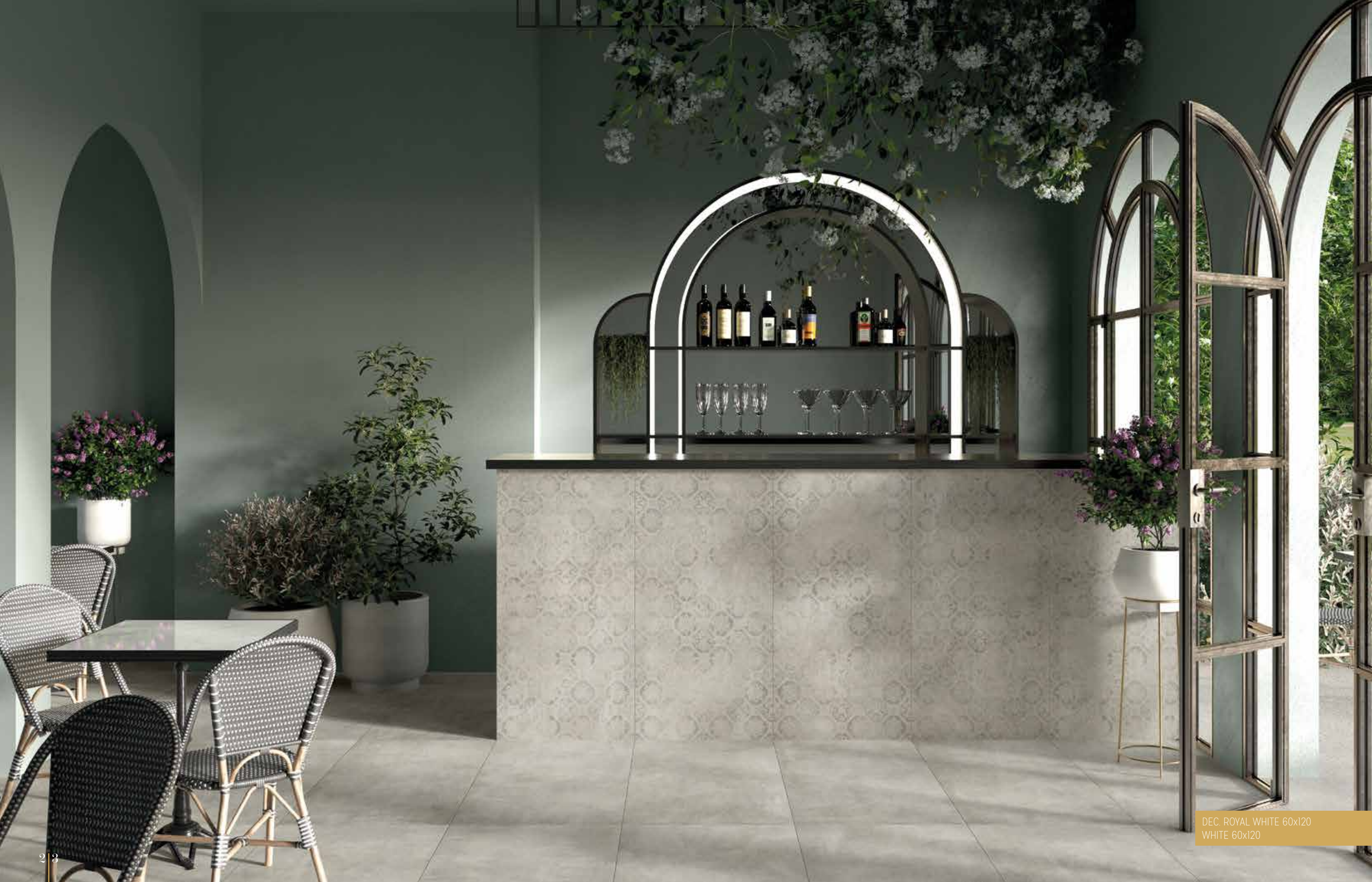
DEC. ROYAL WHITE 60x120 WHITE 60x120