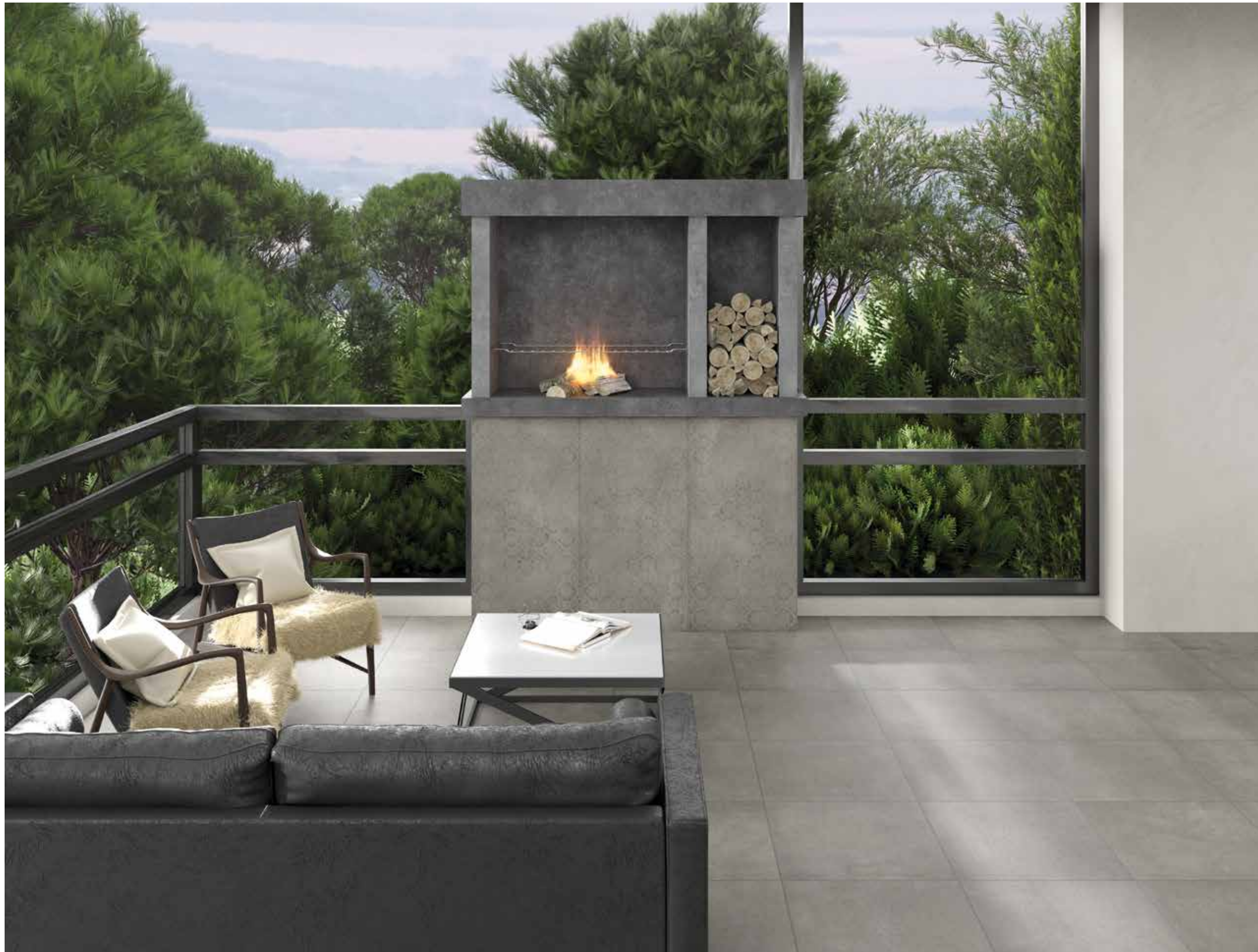
DEC. ROYAL GRAPHITE 60x120 GRAPHITE R11 2CM 60x60